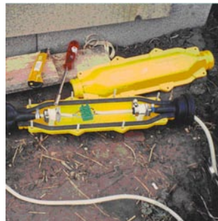
Bornes à choix