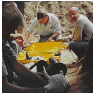
Vaste place de raccordement