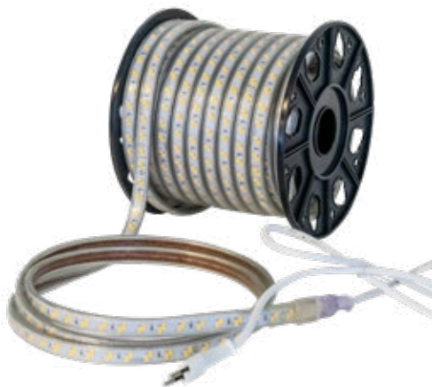
QUICKLED 120 single face

Ideale Lichtverhältnisse auf der Baustelle mit dem Lichtband QUICKLED D'éclairage idéales sur le chantier avec la bande lumineuse QUICKLED